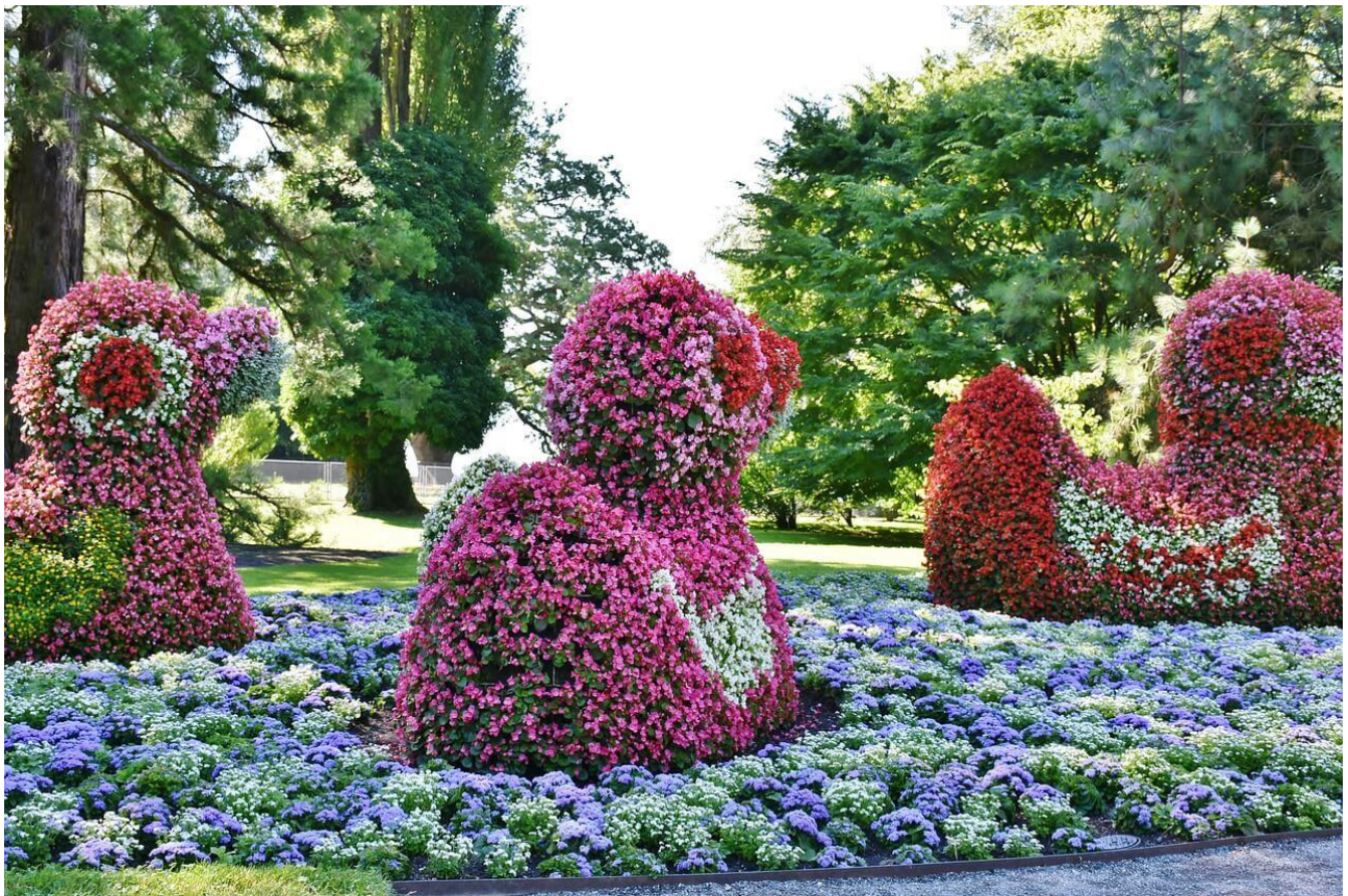
Afbeelding: Bloemeneiland Mainau

Groei & Bloei Terneuzen 4 t/m 7 juni 2020